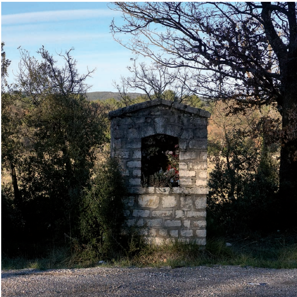
Oratoire Notre-Dame, route de Saint-Maximin

L'oratoire Sainte-Marie, au bord de la route de Saint-Maximin, a de son côté été édifié à l'occasion de l'année mariale de 1954, marquant au passage la sortie nord de la commune. Encore une fois, la statue d'origine a laissé place à une statue de saint Expédit.