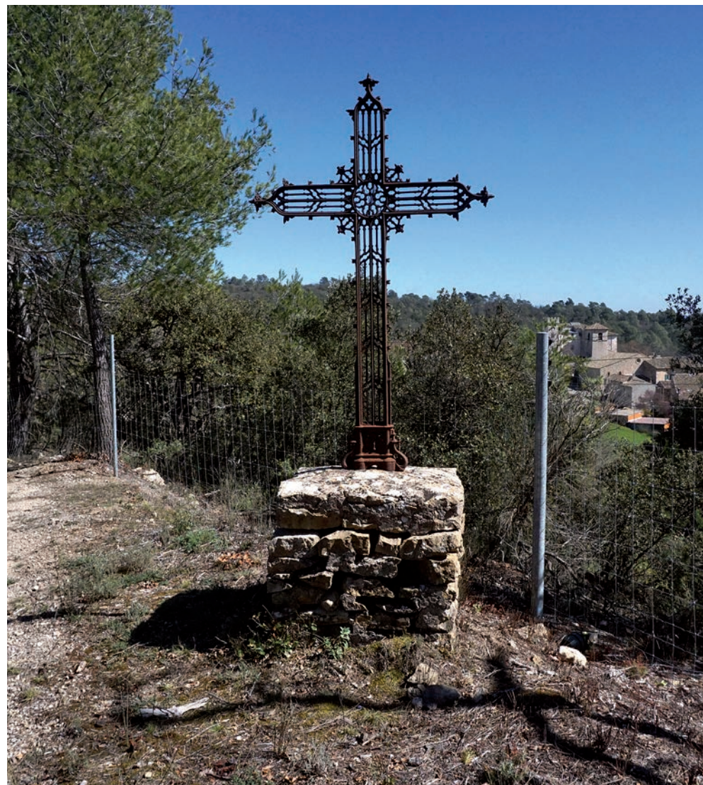
Croix de chemin, en surplomb de l'église

Plusieurs croix, notamment élevées suite à des missions d'évangélisation, ont également parcouru le territoire d'Ollières au fil des siècles.