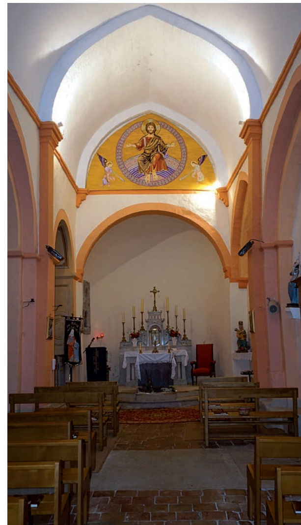
Intérieur de l'église vu depuis la nef

À l'intérieur, la nef, rythmée par trois travées, possède une voûte en berceau brisé et l'abside une voûte en cul-de-four. Au nord, trois chapelles latérales se succèdent d'ouest en est, les chapelles Sainte-Anne et de la Vierge voûtées d'arêtes se distinguant de la chapelle dite du château à l'est, richement peinte et voûtée en berceau plein cintre.