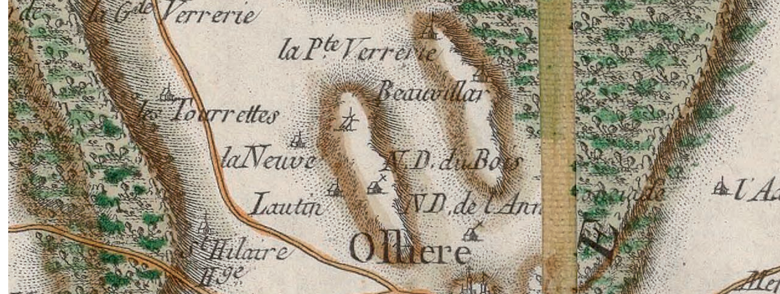
Ollières sur la carte de France dite carte de Cassini, 3 e quart du 18 e siècle

Vous disposez de documents ou possédez des connaissances historiques sur le patrimoine religieux de Provence Verte Verdon ? Contactez sans plus attendre le service Pays d'art et d'histoire - Inventaire du Patrimoine : ipatrimoine@paysprovenceverteverdon.fr 04 98 05 36 16 / 07 86 27 89 31