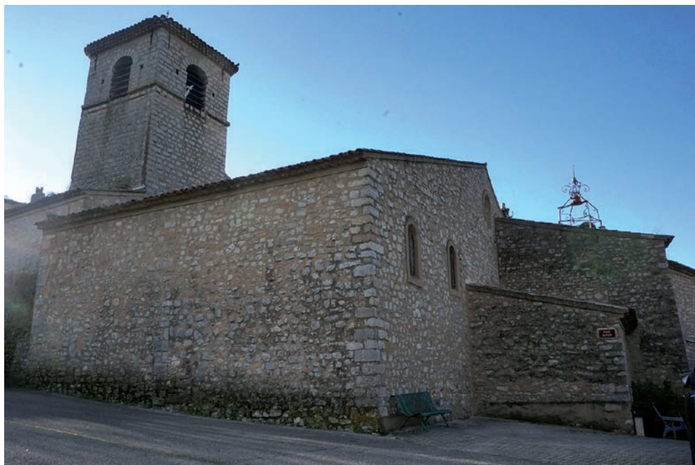
Église paroissiale de La Résurrection du Seigneur vue depuis l'angle nord-ouest

À l'ouest du château d'Ollières, l'église, en moellons et couverte d'un toit à longs pans, présente un plan allongé terminé par un chevet semi-circulaire et soutenu par deux contreforts. Son clocher, aménagé dans une tour carrée de l'ancienne enceinte médiévale, domine à l'angle nord-est. À l'est, un petit passage couvert mène directement à l'ancienne chapelle seigneuriale connue encore aujourd'hui comme chapelle du château. L'église s'ouvre au sud par un portail monumental en pierre de taille probablement en remploi dont l'ornementation a conduit à son inscription au titre des Monuments historiques.