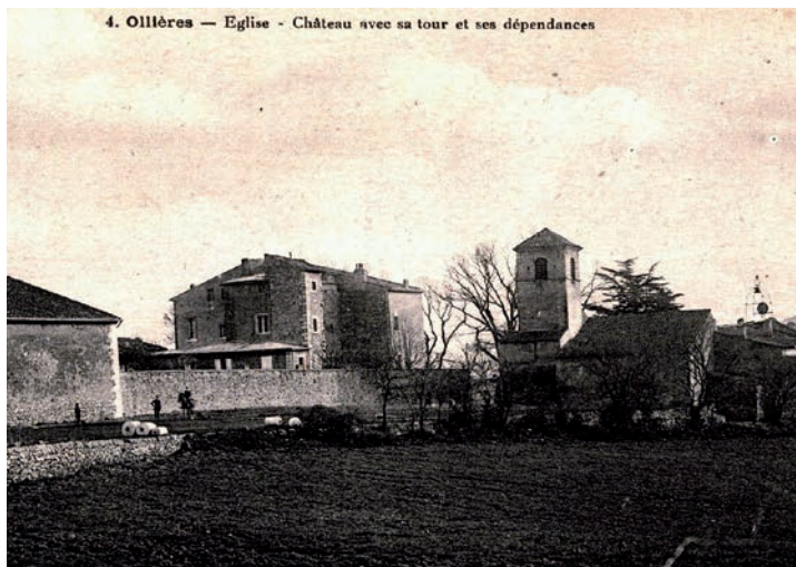
Château et église d'Ollières, 1 er quart du 20 e siècle | Archives départementales du Var, 2 FI OLLIERES 2

comme paroisse les décennies suivantes, l'église est par la suite agrandie au nord de trois chapelles latérales remaniées dans la seconde moitié du 17 e siècle. L'édifice est alors accompagné d'un presbytère sur son angle sud-ouest à ce jour réhabilité et d'un cimetière à l'ouest aujourd'hui disparu. Au 18 e siècle, l'église fait l'objet de premières réparations sur son couvert et son clocher avant d'être grandement restaurée au siècle suivant et dotée d'une nouvelle sacristie à l'emplacement de son cimetière désaffecté. Récemment, ces quarante dernières années, l'édifice a profité de nouvelles campagnes de rénovation. Si l'église est aujourd'hui sous le titre de La Résurrection du Seigneur, elle reste reconnue localement comme l'église Sainte-Anne.