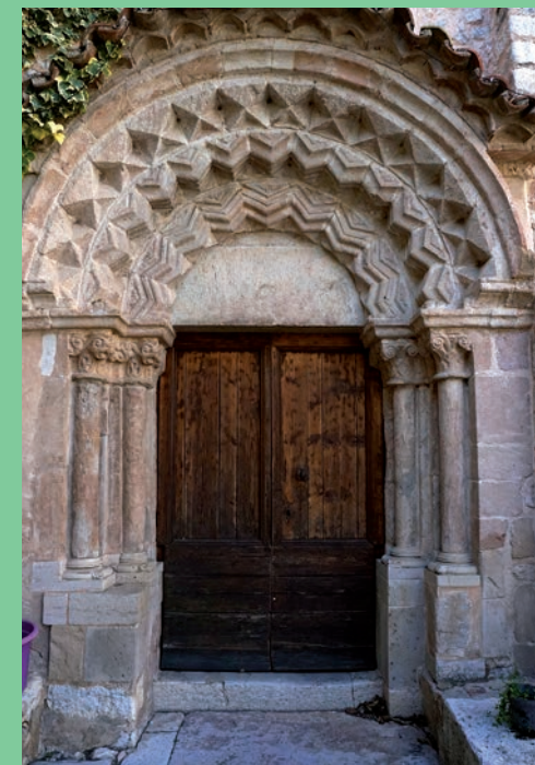
Portail monumental de l'église vu depuis le sud

Sainte Anne, patronne d'Ollières, est fêtée au village fin juillet depuis au moins le 18 e siècle sous la forme d'un romérage alliant fête religieuse et profane. Si la fête patronale a connu un essoufflement dans la seconde moitié du 20 e siècle, elle aujourd'hui à nouveau célébrée avec son cortège processionnel et diverses animations organisées pour l'occasion.