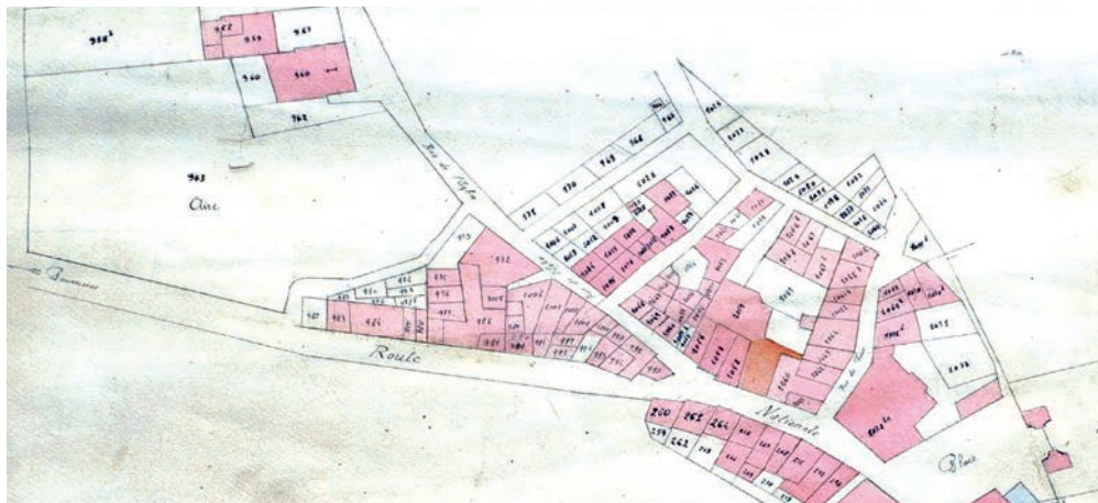
Église paroissiale Notre-Dame-de-l'Assomption sur le plan cadastral, 1809 | Archives départementales du Var, ACPOURCIEUX 002

L'actuelle église Notre-Dame-de-l'Assomption est communément associée à la première église paroissiale Saint-Victor. Cette dernière, vraisemblablement en grande partie reconstruite, remaniée puis agrandie au cours des 14 e et 15 e siècles, connaît encore des agrandissements au 17 e siècle, son clocher reconstruit en 1665. Elle prend alors le vocable marial de Notre-Dame-de-Nazareth. Un siècle plus tard, l'église fait l'objet de nouveaux remaniements. En 1783, l'édifice est notamment réorienté à l'ouest, sa porte transférée à l'est, mais est aussi doté d'une nouvelle chapelle sud-est et son clocher