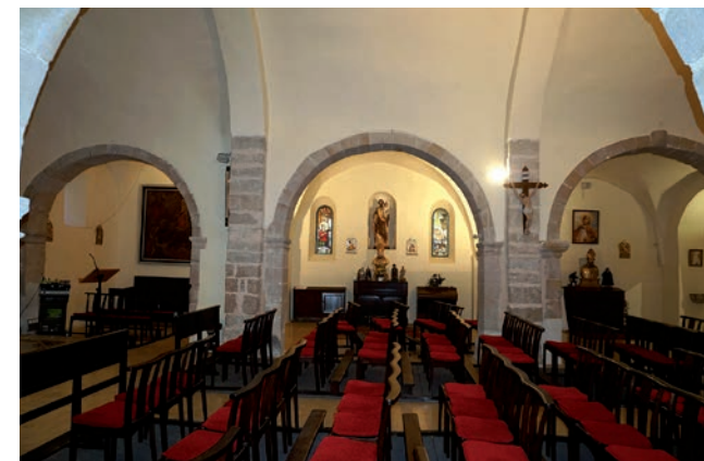
Chapelles latérales nord vues depuis le sud