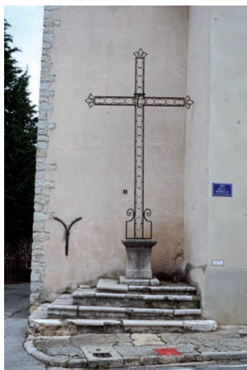
Croix monumentale, rue Marius-Bourrelly