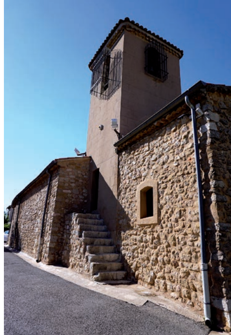
Clocher et son escalier vus depuis l'angle sud-est

Située au nord-ouest du village, l'église est mitoyenne de l'actuelle mairie qui abritait initialement le presbytère. À l'ouest et au sud, des placettes occupent respectivement l'emplacement du cimetière paroissial, transféré dans les années 1850, et du jardin presbytéral. L'édifice, de plan allongé, se termine par un chevet semi-circulaire. Il est monté principalement en moellons de grès et couvert par un toit à longs pans à génoise pour sa nef et par un toit à croupe ronde pour son chevet.