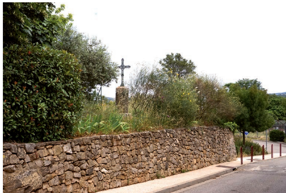
Croix de chemin, près de la mairie

Enfin, la croix de Pourcieux, visible depuis le village, domine et marque l'ensemble du territoire pourciérain. Dernière d'une série, l'existence d'une croix de bois se lit déjà dans les vers de Marius Bourrelly en 1868. Au sud, implantée au sommet de la colline de la Coquille, elle est accessible par un chemin de randonnée.