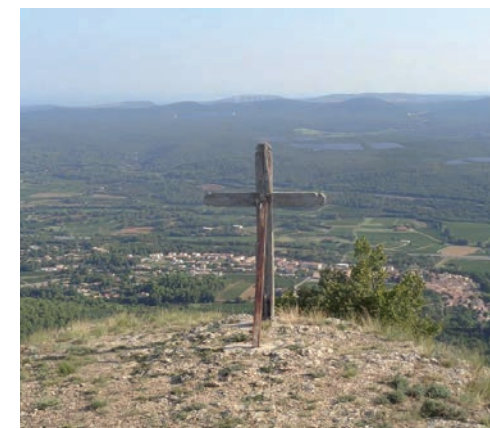
Croix de Pourcieux, colline de la Coquille

Ainsi, oratoires et croix continuent de revêtir à Pourcieux une fonction de marqueur spatial au sein et aux alentours du village.