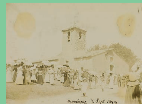
Jeux floraux organisés en l'honneur de Marius Bourrelly par Léon Spariat, félibre et curé de Pourcieux, 3 septembre 1899

Si aujourd'hui la plupart de ces lieux de culte ont disparu au gré de la baisse des dévotions à l'image de la chapelle Saint-Martin dans les années 1970, Pourcieux n'en garde pas moins une histoire religieuse remarquable, incarnée aujourd'hui par son église paroissiale.