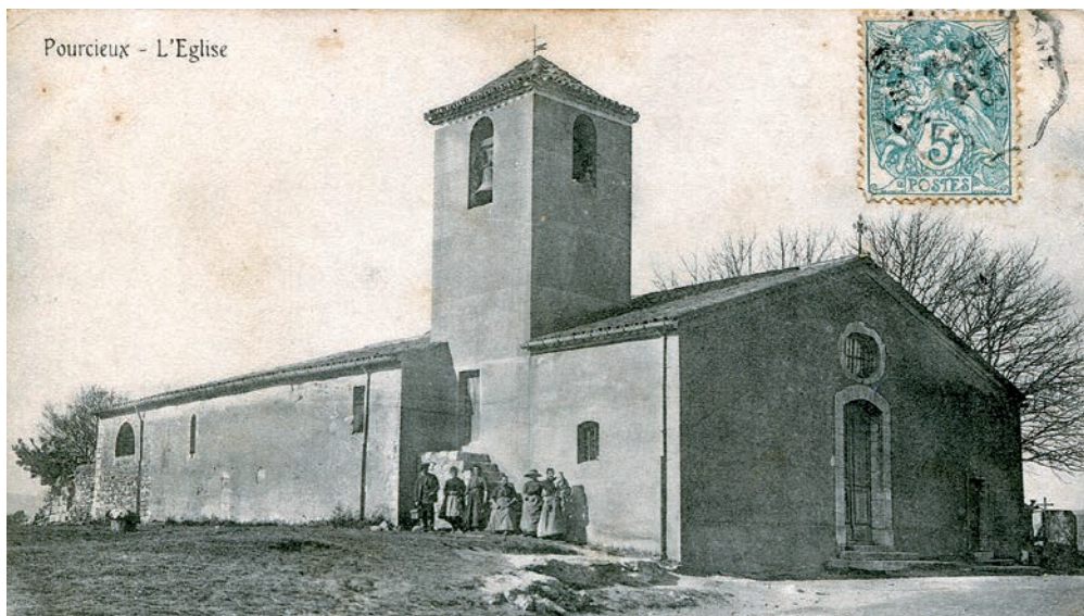
Pourcieux - L'Église, premier quart du 20 e siècle

remanié et annexé d'un escalier extérieur. À cette période, l'église paroissiale est définitivement reconnue sous le titre de Notre-Dame-de-l'Assomption. Au 19 e siècle, des réparations sont faites et l'actuelle sacristie construite au sud-ouest dans la seconde moitié du siècle, comme vraisemblablement le chevet semi-circulaire. Depuis, d'importantes campagnes dans les années 1970 et 1980 ont permis la réfection du sol, des façades et du couvert de l'édifice. Encore aujourd'hui, des travaux de restauration sont régulièrement programmés pour sa conservation.