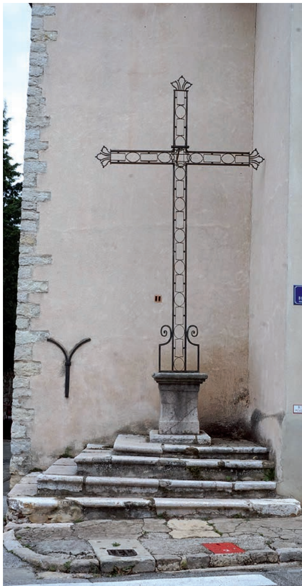
Croix monumentale, rue Marius-Bourrelly

Une troisième croix, élevée possiblement dans la seconde moitié du 19 e siècle, marque à l'ouest du village, le long du chemin du Deffends, la proximité du cimetière communal situé à quelques mètres.