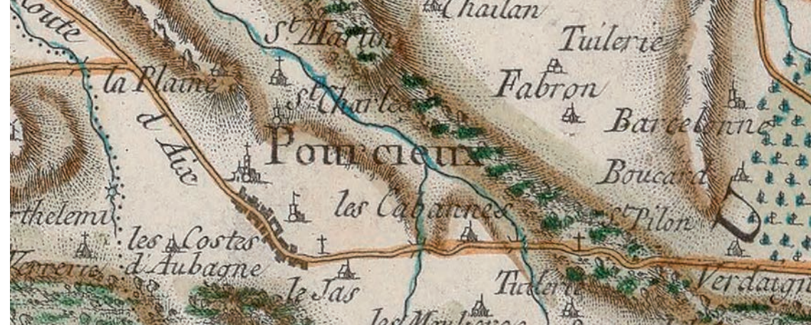
Pourcieux sur la carte de France dite carte de Cassini, 3 e quart du 18 e siècle

Vous disposez de documents ou possédez des connaissances historiques sur le patrimoine religieux de Provence Verte Verdon ? Contactez sans plus attendre le service Pays d'art et d'histoire - Inventaire du Patrimoine : ipatrimoine@paysprovenceverteverdon.fr - 04 98 05 36 16 / 07 86 27 89 31