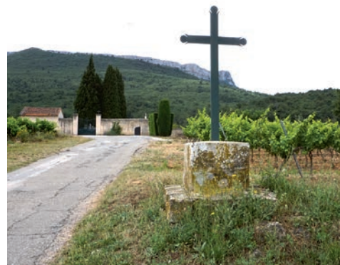
Croix de chemin, près du cimetière

Enfin, la croix de Pourcieux, visible depuis le village, domine et marque l'ensemble du territoire pourciérain. Dernière d'une série, l'existence d'une croix de bois se lit déjà dans les vers de Marius Bourrelly en 1868. Au sud, implantée au sommet de la colline de la Coquille, elle est accessible par un chemin de randonnée.